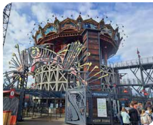
Nantes - Le Carroussel