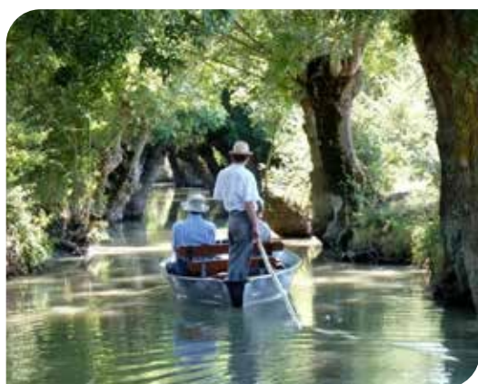
Le marais Poitevin

Rappel : n'hésitez pas à consulter notre site internet pour découvrir toutes les propositions des partenaires de la SRIAS et à vous abonner à notre newsletter.