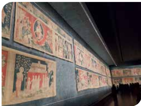
Angers La salle des tapisseries