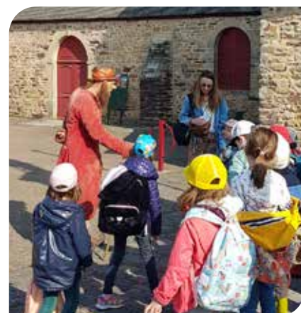
Brocéliande «Le Conteur»

Dans le cadre du suivi du parc de R.I.A. sur la région Pays de la Loire, la SRAS émet des avis sur les demandes de financements présentées par ces structures collectives, pour des travaux de remises aux normes et veille à leur bon fonctionnement. La SRIAS a ainsi participé activement à la création du nouveau RIA, dans la nouvelle cité administrative « Doumergue » à Nantes et a veillé à ce que ce RIA réponde aux attentes des agents. Il est important en ce sens de participer au bon fonctionnement des associations existantes pour gérer les RIA et faire en sorte que l'offre de repas proposée soit bien adaptée. Les membres de la SRIAS tiennent particulièrement à cette offre de restauration pour l'ensemble des agents. Nos collègues retraités peuvent aussi accéder à ces structures.