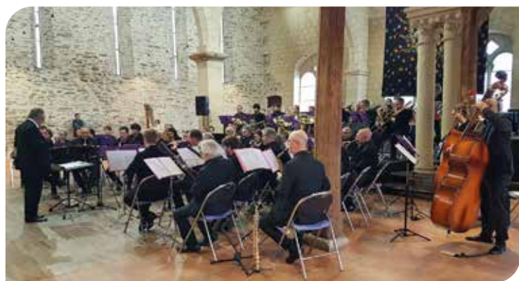
Angers - Concert au Grenier Saint Jean