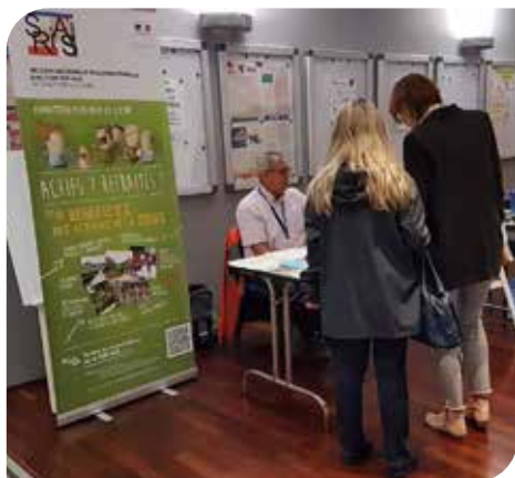
Forum «Actions sociales»

Notre principal regret vous vous en doutez c'est de n'avoir pu répondre à toutes les demandes de participation à nos actions.