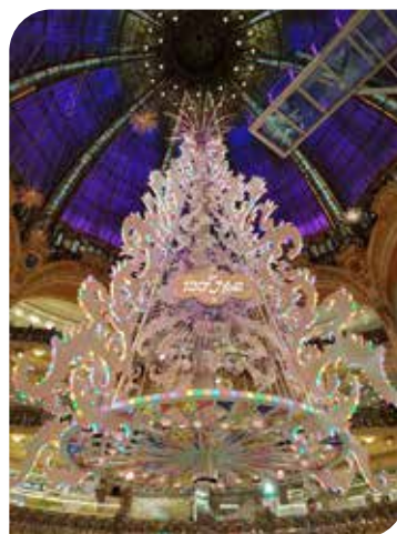
Paris - Le sapin des Galeries Lafayette

A noter que la SRIAS dispose de 5 places réservées dans un foyer d'hébergement temporaire à St Gilles Croix de Vie pour les collègues de la Vendée. Ce dispositif est géré par le SGCD de la Vendée.