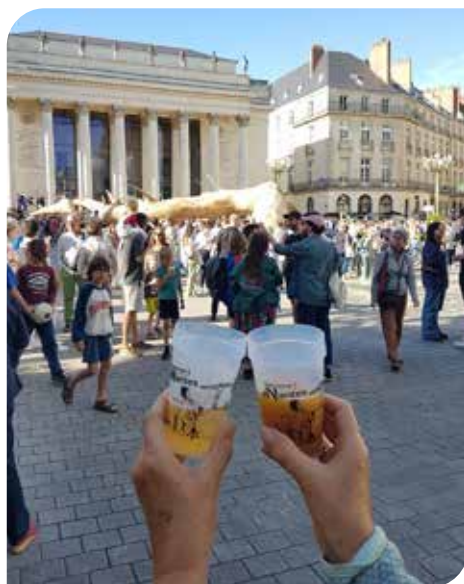
Nantes - Inauguration «Le Voyage à Nantes»