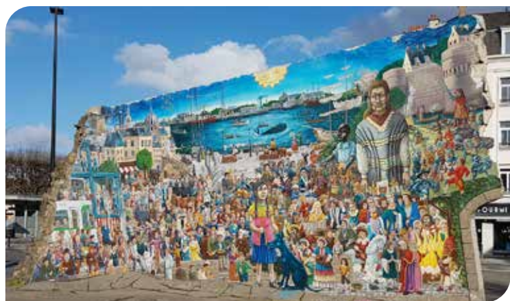
Nantes - La Fresque «personnages célèbres»