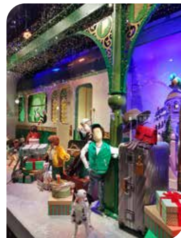
Paris - Vitrine «Le Printemps»